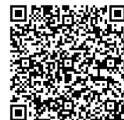
個人戦申込みフォーム