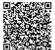
団体戦申込みフォーム